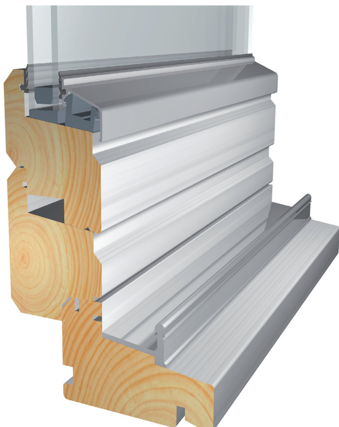
Tegningene viser hardvedterskel